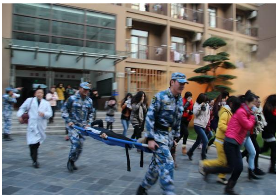
(高层学生宿舍楼消防逃生演练)

年新生入校 下发人手一 本《上海市大 学生安全教 育读本》。 2013 年 9 月 30 日上午 10 点至 11 点, 嘉定人民广 播电台《民生 热线》